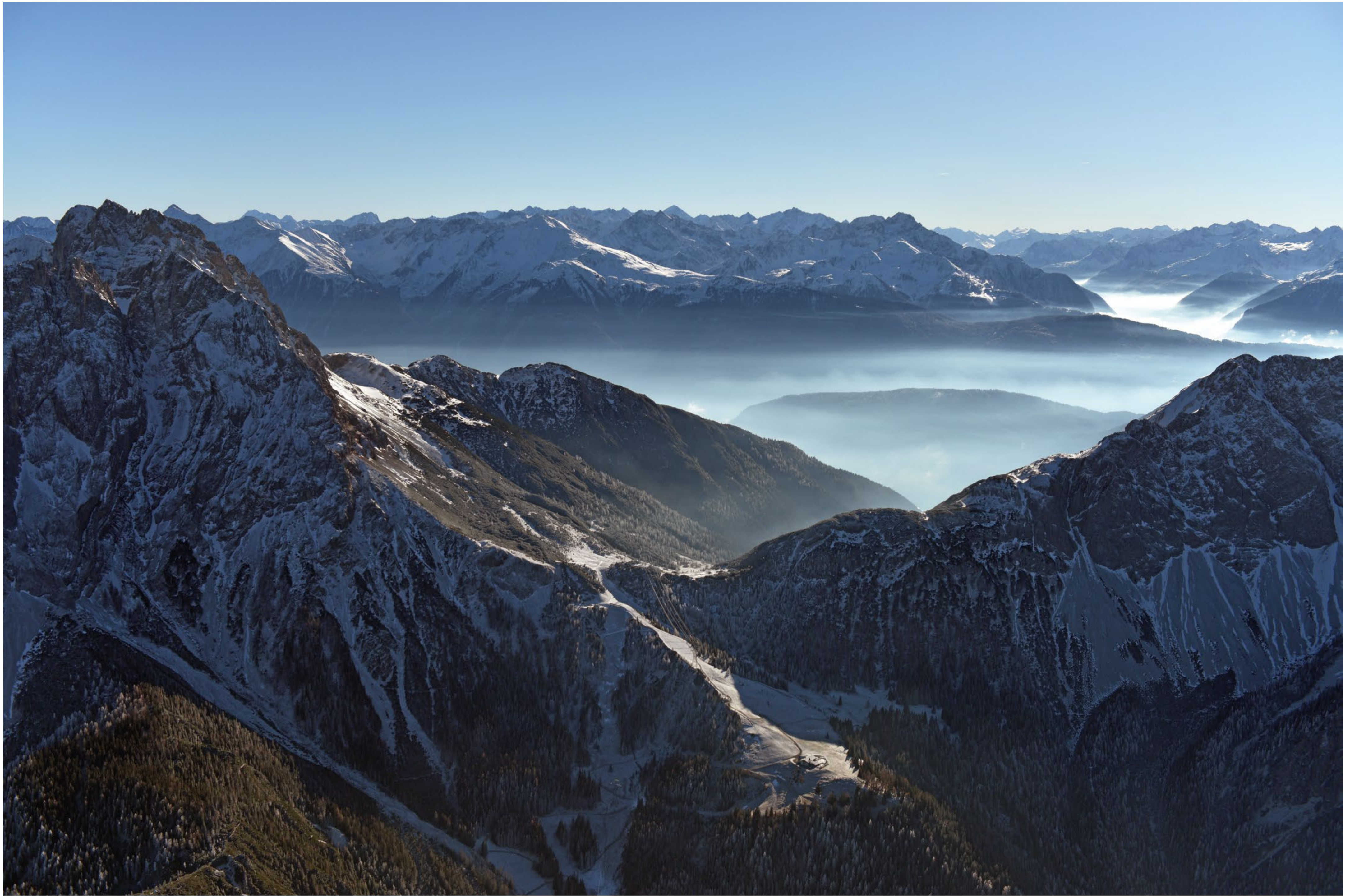
Marienbergalm mit Blick ins Inntal